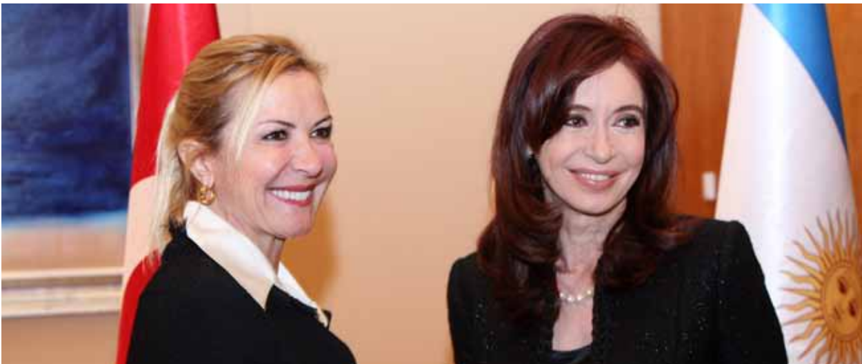
TÜSİAD Yönetim Kurulu Başkanı Ümit Boyner ve Arjantin Devlet Başkanı Christina Fernandez Kirchner, 21 Ocak 2011.