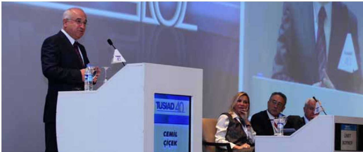
TBMM Başkanı Cemil Çiçek, TÜSİAD Yüksek İstişare Konseyi, 9 Aralık 2011.

TÜSİAD, 40. yıl faaliyetleri kapsamında “21. Yüzyılda Devlet ve Birey” konulu bir forum düzenlemiştir ( 23 Mart 2011 ). Demokratikleşme çalışmalarını destekleyici nitelikte olan “21. Yüzyılda Devlet ve Birey” teması, yurtdışından ve yurtdışından önemli siyasetçi, gazeteci ve akademisyenler ile birlikte yarım günlük bir forum kapsamında tartışılmıştır. Forumun ilk oturumunda Güney Afrikalı insan hakları savunucusu Avukat Brian Currin, İspanya hükümetinin eski Başbakan Yardımcısı ve eski Savunma Bakanı Narcis Serra ve eski İspanya Başbakanı (1982-1996) ve AB Bilge Adamlar Grubu Başkanı Felipe Gonzalez birer konuşma gerçekleştirerek konuya uluslararası bir perspektif kazandırmışlardır.