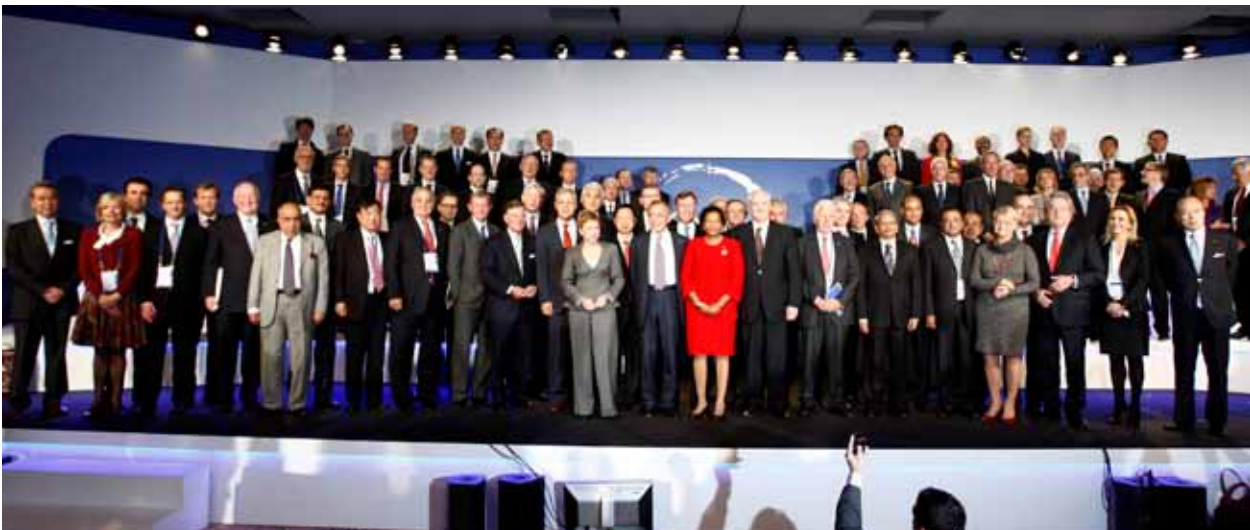
TÜSİAD Yönetim Kurulu Başkanı Ümit Boyner başkanlığındaki TÜSİAD heyetinin katılımıyla B20 (Business 20) Zirvesi, Cannes, 3 Kasım 2011.

Özel sektör karar vericileri arasındaki etkileşimi artırmak ve kurumun makro ekonomik analiz yeteneğini geliştirmek amacıyla oluşturulan TÜSİAD CEO Forumu'nun 2011 yılı