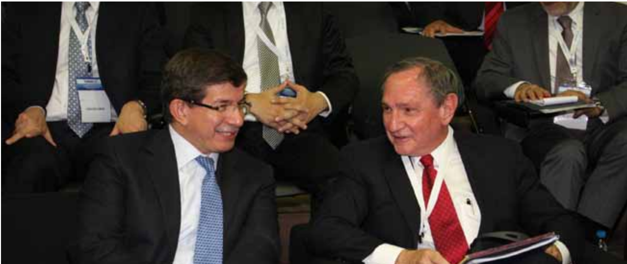
Dışişleri Bakanı Prof. Dr. Ahmet Davutoğlu ve STRATFOR Enstitüsü'nün kurucusu George Friedman'ın katılımıyla "Küresel Enerji Stratejileri Simülasyonu", 6 Ekim 2011.

TÜSİAD, Danimarka Dışişleri Bakanı Lene Espersen'in Türkiye'ye gerçekleştirdiği ziyaret çerçevesinde, Maliye Bakanı Mehmet Şimşek'in katılımıyla, İstanbul'da her