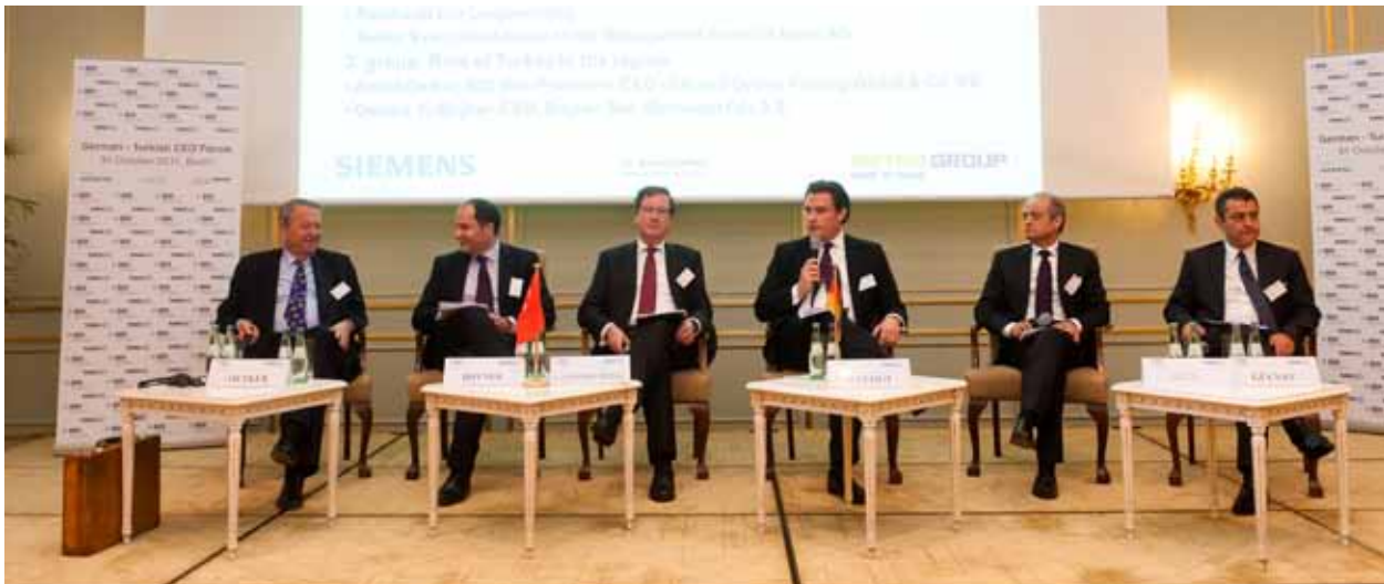
Alman-Türk CEO Forumu, Berlin, 31 Ekim 2011.

TÜSİAD International tarafından Alman Sanayici Federasyonu (BDI) ile işbirliği içinde “Alman-Türk CEO Forumu” Berlin’de düzenlenmiştir (31 Ekim 2011) . Her iki ülkeden üst düzey siyasetçiler, iş dünyası temsilcileri ve kanaat önderlerinin yer aldığı forumda, iki ülke arasındaki ekonomik ilişkiler ele alınmış; “Altyapı Projeleri”, “Her İki Ülkedeki Ticari Sektörlerdeki Potansiyeller ve İşbirlikleri” ile “Türkiye’nin Bölgedeki Rolü” başlıklı üç yuvarlak masa toplantısı yapılmıştır.