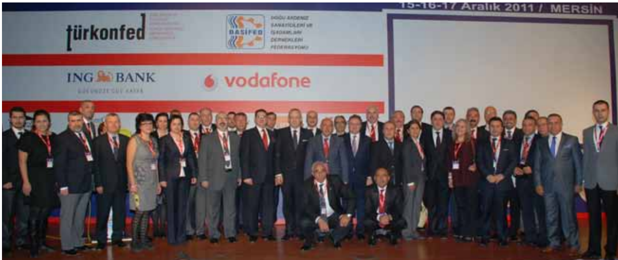
TÜRKONFED 15. Girişim ve İş Dünyası Zirvesi, Mersin, 15-16 Aralık 2011.

TÜRKONFED, UBCCE IV. İş Forumu kapsamında, Gürcistan'ın Batum şehrine iş geliştirme gezisi gerçekleştirmiştir (30 Haziran-2 Temmuz 2011) . Forumda, Gürcistan Girişimciler Konfederasyonu, TÜRKONFED ve Gürcistan Yatırım Ajansı arasında üçlü mutabakat zaptı imzalanmıştır.