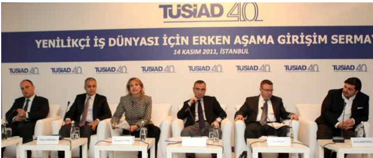
TÜSİAD Teknoloji ve İnovasyon Çalışma Grubu tarafından düzenlenen “Yenilikçi İş Dünyası İçin Erken Aşama Girişim Sermayesi Semineri”, 14 Kasım 2011.