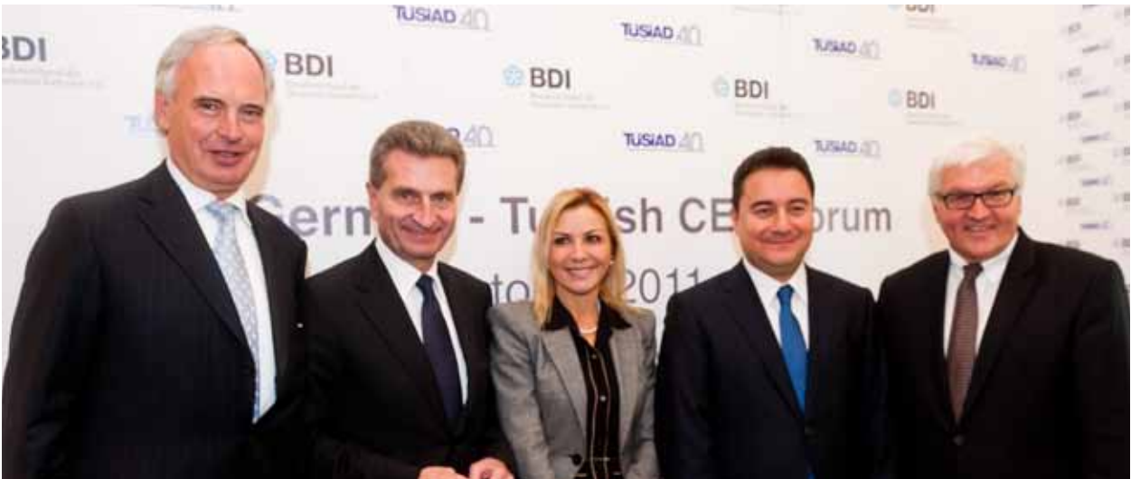
BDI Yönetim Kurulu Başkanı Hans-Peter Keitel, Avrupa Komisyonu Enerjiden Sorumlu Üyesi Günther Oettinger, TÜSİAD Yönetim Kurulu Başkanı Ümit Boyner, T.C. Başbakan Yardımcısı Ali Babacan, Federal Almanya Parlamentosu SPD Grup Başkanı, Eski Şansölye Yardımcısı ve Dışişleri Bakanı Dr. Frank-Walter Steinmeier, 31 Ekim 2011.

TÜSİAD Berlin Bürosu, Türkiye'nin iletişim ve tanıtım çalışmalarına katkı sağlamak amacıyla, Türkiye'nin stratejik coğrafi konumunun, ekonomik büyüme kapasitesinin, girişimcilerinin potansiyelinin anlatıldığı ve ülkenin, eğitim ve sanat alanında attığı başarılı adımların derlendiği "Turkey: A Culture of Change/Die Türkei: eine Kultur des Wandels" başlıklı tanıtım kitabının oluşturulmasına katkıda bulunmuştur. Almanca ve İngilizce hazırlanan kitapta Türkiye'nin önemli özellikleri altı ana tema altında toplanmıştır. Tanıtım kitabı Berlin'de düzenlenen Türk-Alman CEO Forumu kapsamında basın mensuplarına ve iş dünyasına tanıtılmıştır ( 31 Ekim 2011 ). Kitap bu tanıtım akabinde federal ve yerel parlamento temsilcileri, akademisyenler, iş dünyası temsilcileri, sivil toplum kuruluşları temsilcileri ve diğer karar verici mekanizmalarla paylaşılmıştır.