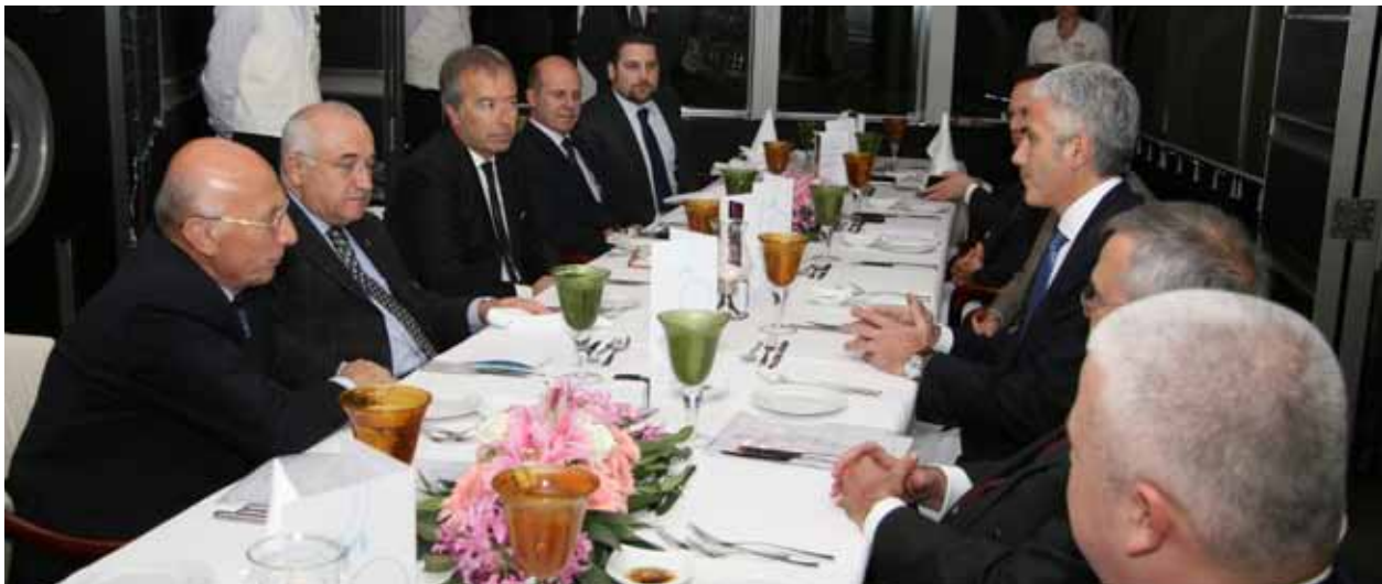
TÜSİAD Yönetim Kurulu Başkan Yardımcısı ve Parlamento İşleri Komisyonu Başkanı Haluk Dinçer’in başkanlığındaki heyetin, dönemin Devlet Bakanı ve Başbakan Yardımcısı Cemil Çiçek ile toplantısı, 26 Ocak 2011.

TÜSİAD Genel Sekreterliği bünyesinde yer alan Siyasi Reformlar Bölümü, Parlamento İşleri Komisyonu’nun çalışmalarını desteklemektedir.