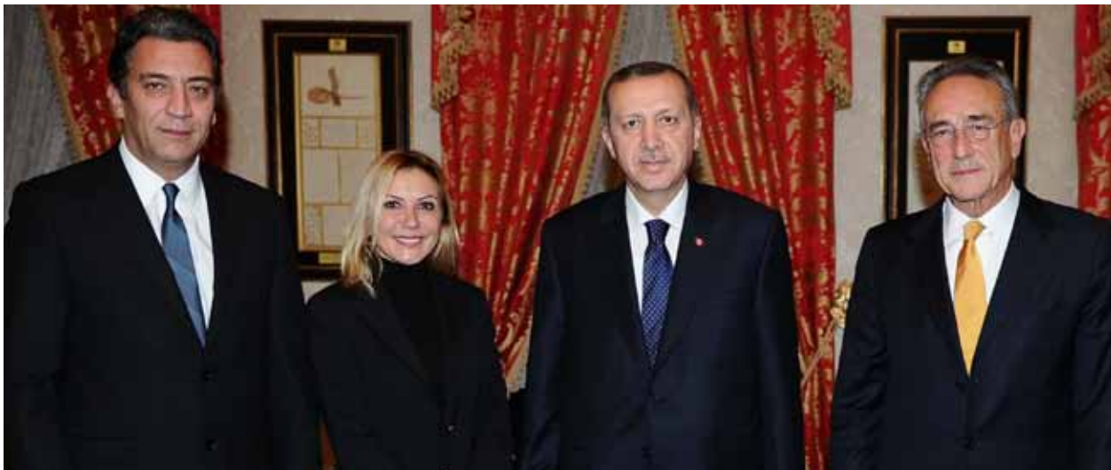
TÜSİAD Yüksek İstişare Konseyi Başkanı Erkut Yücaoglu, Yönetim Kurulu Başkanı Ümit Boyner ve Genel Sekreter Zafer Ali Yavan'ın Başbakan Recep Tayyip Erdoğan'ı ziyareti, 20 Aralık 2011.

Diğer üye etkileşim unsuru, bir eski dönem ve bir cari dönem TÜSİAD Yönetim Kurulu üyesinin, üyeler ile bir araya gelerek "reel politika" sohbeti yapmasını içermektedir. Bu faaliyet, kurumsal devamlılık sürecine destek olacağı ve kurumsal hafızayı canlı tutacağı beklentisi ile kurgulanmış ve bu kapsamda 5 adet toplantı düzenlenmiştir.