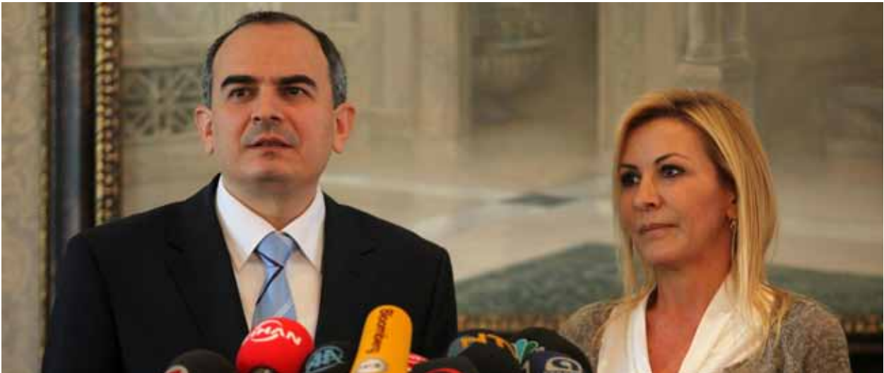
TCMB Başkanı Erdem Başçı ve TÜSİAD Yönetim Kurulu Başkanı Ümit Boyner, TÜSİAD CEO Forumu, 1 Ekim 2011.

Ekonomik ve Mali İşler Komisyonu, TÜSİAD'ın içsel bütünlüğe sahip politika önerileri oluşturma çalışmalarını, analitik düşünme ve iş deneyimini birleştirerek desteklemektedir. TÜSİAD Genel Sekreterliği bünyesinde yer alan Ekonomik Araştırmalar Bölümü'nün katkılarıyla yürütülen Komisyon faaliyetlerinde ortaya konulan etkin ve sürekli istişare yaklaşımı, TÜSİAD'ın ekonomik konularda görüşlerinin etkili, zamanında ve güvenilir olma boyutlarına güç katmaktadır. Komisyon, Türkiye ekonomisinin daha dinamik, yenilikçi, verimli ve sürdürülebilir bir patikada ilerlemesine katkıda bulunmayı hedeflemektedir.