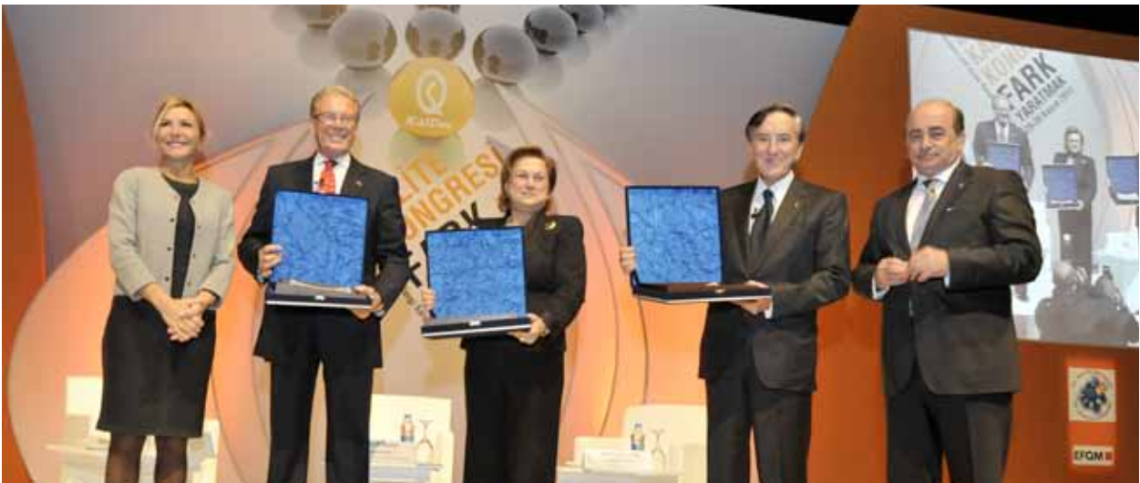
TÜSİAD Yönetim Kurulu Başkanı Ümit Boyner ve KalDer Yönetim Kurulu Başkanı Hamdi Doğan tarafından, 20. Kalite Kongresi'nin açılış özel oturumuna katılan Uğur Dündar, Sabancı Holding Yönetim Kurulu Başkanı Güler Sabancı ve Eczacıbaşı Holding Yönetim Kurulu Başkanı Bülent Eczacıbaşı'na plaket takdimi, 29 Kasım 2011.

Kalite bilincinin ve toplam kalite yönetiminin yaygınlaştırılması amacıyla düzenlenen Ulusal Kalite Kongresi, "Fark Yaratmak" ana teması ile İstanbul'da toplanmıştır ( 29-30 Kasım 2011 ). Kongrenin açılış konuşmalarını TÜSİAD Yönetim Kurulu Başkanı Ümit