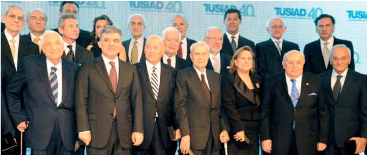
Cumhurbaşkanı Abdullah Gül ve 9. Cumhurbaşkanı Süleyman Demirel’in katılımıyla TÜSİAD 40. Kuruluş Yılı Gala Yemeği, TÜSİAD Üyelerine Plaket Takdim Töreni, 22 Mart 2011.

Konferansta, TÜSİAD Yönetim Kurulu Başkanı Ümit Boyner, Enerji ve Tabii Kaynaklar Bakanı Taner Yıldız ve Dışişleri Bakanı Prof. Dr. Ahmet Davutoğlu birer konuşma gerçekleştirmiştir. İnteraktif bir yapıda kurgulanan simülasyonun katılımcıları ise, kendilerine sunulan bir başlangıç senaryosu ve ülke pozisyonlarından yola çıkarak geldikleri ülkelerin karar alıcıları rolünü oynamış ve 2012-