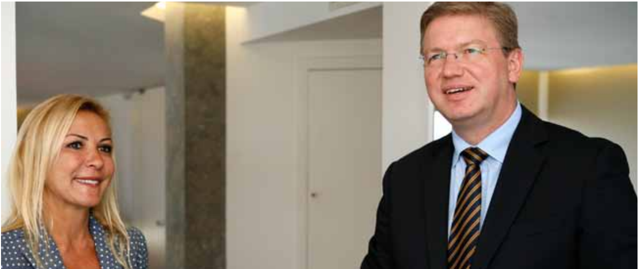
TÜSİAD Yönetim Kurulu Başkanı Ümit Boyner ve Avrupa Komisyonu Genişleme ve Komşuluk Politikasından Sorumlu Üyesi Stefan Füle, 12 Temmuz 2011.