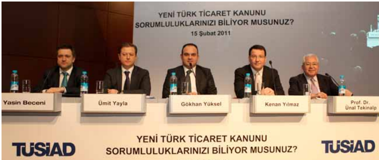
TÜSİAD Şirketler Hukuku Çalışma Grubu tarafından düzenlenen “Yeni Türk Ticaret Kanunu: Sorumluluklarınızı Biliyor Musunuz? Semineri”, 15 Şubat 2011.