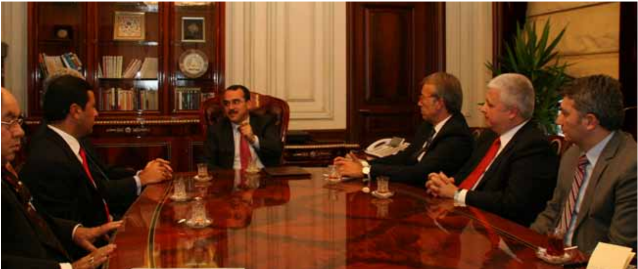
TÜSİAD Parlamento İşleri Komisyonu'nun Adalet Bakanı Sadullah Ergin'i ziyareti, 26 Ekim 2011.