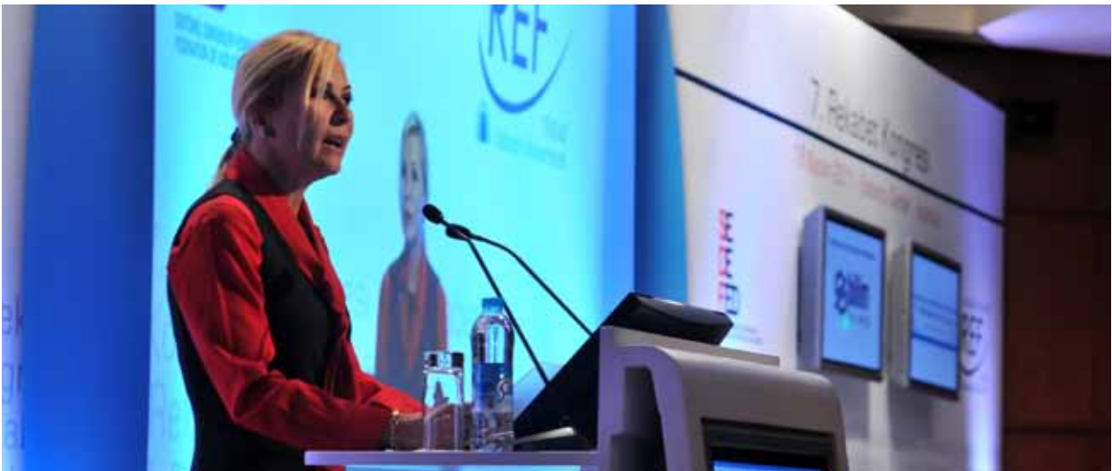
TÜSİAD Yönetim Kurulu Başkanı Ümit Boyner, REF-SEDEFED 7. Rekabet Kongresi, 16 Kasım 2011.

“İstanbul Bilgi Toplumu İzleme Projesi”nde sektörün beklenti analizi, Ar-Ge ve inovasyon kapasitesinin izlenmesi için geliştirilecek olan metodun belirlenmesi gibi araştırma alanlarındaki sorumluluk REF tarafından üstlenilmiştir.