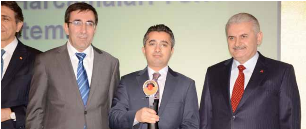
Kalkınma Bakanı Cevdet Yılmaz ve Ulaştırma, Denizcilik ve Haberleşme Bakanı Binali Yıldırım'ın katılımıyla TÜSİAD-TBV eTR Ödül Töreni, 19 Aralık 2011.

2011 yılı teması “Medeni Yargılama Hukuku-Bilirkişilik” olarak açıklanan ödüle başvuru süreci yıl sonunda tamamlanmış olup 2011 yılı ödülünün 2012 yılı başında verilmesi planlanmıştır.