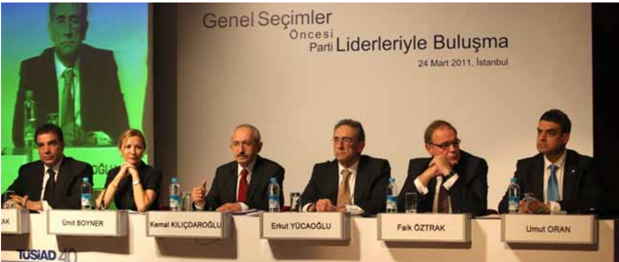
CHP Genel Başkanı Kemal Kılıçdaroğlu, TÜSİAD Genel Seçimler Öncesi Parti Liderleriyle Buluşma Toplantısı, 24 Mart 2011.