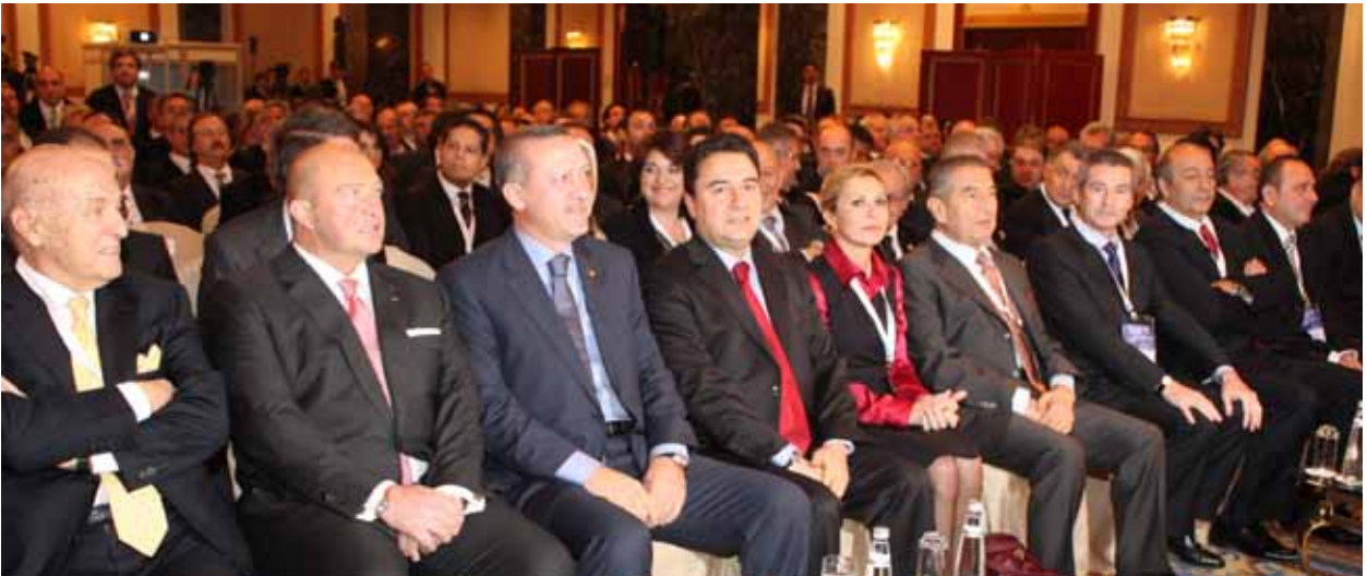
Başbakan Recep Tayyip Erdoğan ve Başbakan Yardımcısı Ali Babacan'ın katılımıyla TÜSİAD 41. Genel Kurul Toplantısı, 20 Ocak 2011.