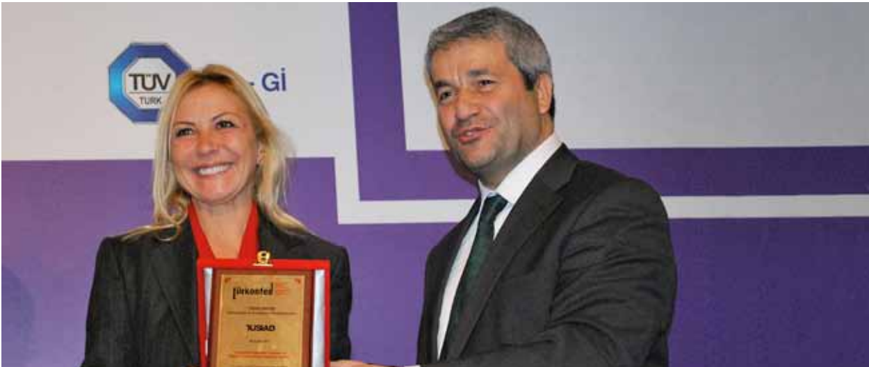
TÜSİAD Yönetim Kurulu Başkanı Ümit Boyner ve Bilim, Sanayi ve Teknoloji Bakanı Nihat Ergün, TÜRKONFED Başkanlar Konseyi, Ordu, 15 Nisan 2011.