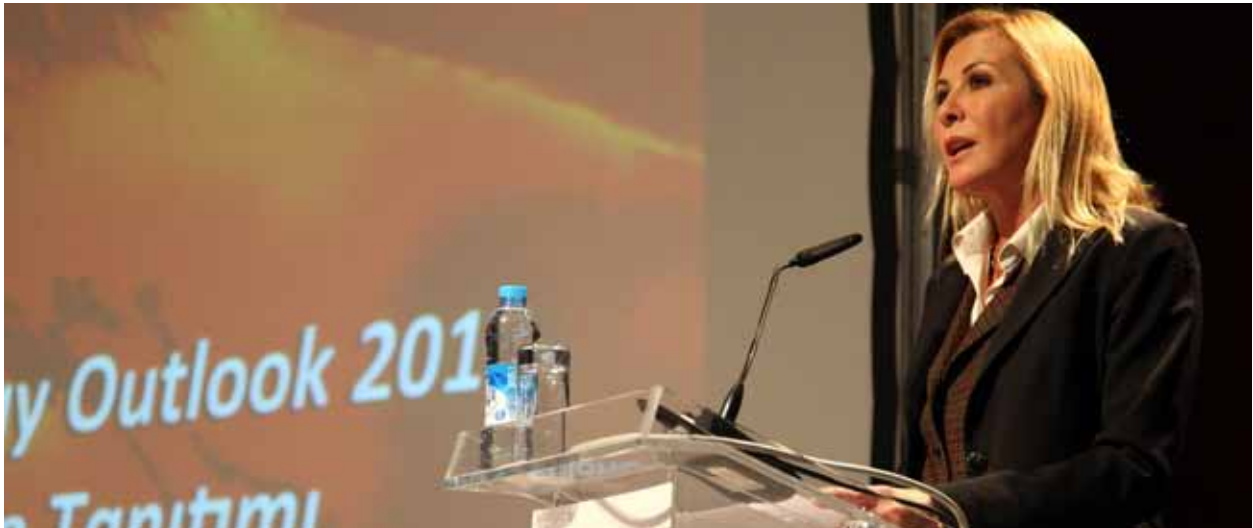
TÜSİAD Yönetim Kurulu Başkanı Ümit Boyner, Uluslararası Enerji Ajansı "World Energy Outlook" Raporu Türkiye Tanıtımı, 1 Aralık 2011.