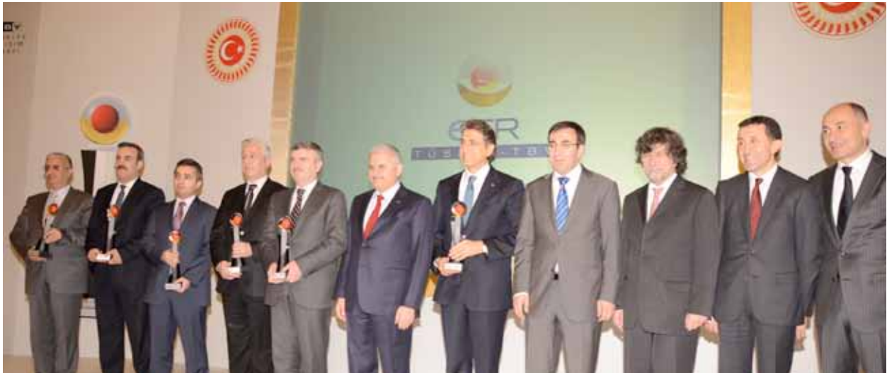
TÜSİAD Yönetim Kurulu Üyesi ve Teknoloji, İnovasyon ve Bilgi Toplumu Komisyonu Başkanı Erman Ilıcak'ın açılış konuşmasını yaptığı, Ulaştırma, Denizcilik ve Haberleşme Bakanı Binali Yıldırım ve Kalkınma Bakanı Cevdet Yılmaz'ın katılımıyla düzenlenen TÜSİAD-TBV eTR Ödülleri Töreni, TBMM, 19 Aralık 2011.