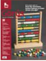
Görüş no. 66-71

2004 yılında yayınına ara veren TÜSİAD'ın "Görüş" dergisi, 2010 yılında yayın hayatına geri dönmüştür. 2011 yılında yayınlanan sayılardan, 66'nın kapak konusu "Un var, yağ var, şeker var... Kayıtdışı ekonomiye, kayıtsız kalmaya ne kadar devam edeceğiz?" şeklinde belirlenmiştir. Görüş'ün yıl içinde çıkan diğer sayıları ise sırasıyla "Daha çok kadın daha iyi siyaset", "Enerji: Zor Denklem", "Ortadoğu'da siyaset: İklim değişiyor", "İsrail-Türkiye: Quo Vadis?" (Nereye?), "Onyıllardır bekleyen reform: Vergi" başlıklı kapak konularını içermiştir.