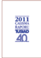
TÜSİAD 2011 Çalışma Raporu

TÜSİAD Ekonomik Araştırmalar Bölümü tarafından hazırlanan rapor, içinde bulunan yıl ile ilgili Türkiye ve dünya ekonomisini değerlendirmekte ve gelecek yıl için TÜSİAD'ın temel ekonomik değişkenlere yönelik resmi tahminlerini içermektedir.