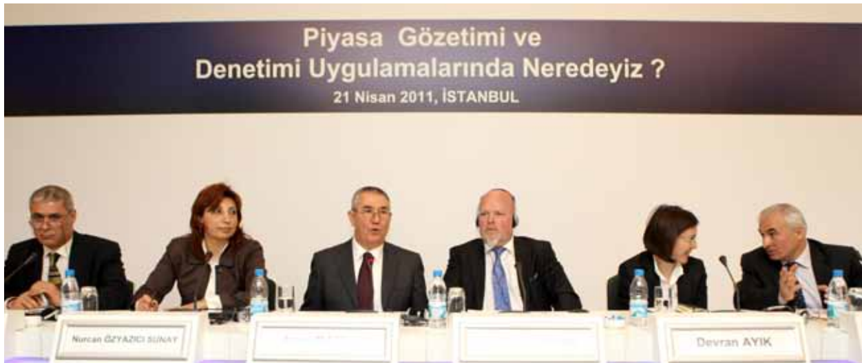
TÜSİAD Dış Ticaret ve Gümrük Birliği Çalışma Grubu tarafından düzenlenen “Piyasa Gözetimi ve Denetimi Uygulamalarında Neredeyiz?” Semineri, 21 Nisan 2011.

Komisyon Üyesi Mustafa Fethi Gürbüz’ün başkanlığında kurulan çalışma grubu Türkiye-KKTC arasındaki siyasi ve ekonomik ilişkileri ele almayı, Kıbrıs sorunundaki gelişmeleri değerlendirmeyi ve iş dünyasının desteğine yönelik mekanizmalara katkı sağlamayı hedeflemiştir.