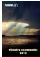
Türkiye Ekonomisi 2012

TÜSİAD Medya İlişkileri Bölümü tarafından aylık olarak hazırlanan yayın, TÜSİAD faaliyetleri ile ilgili özet bilgi sunmaktadır. Görsellerle renklendirilen TÜSİAD Manşet, toplantılar, yurtiçi ve yurtdışı temaslar ile TÜSİAD yönetim kurulu başkanı ve üyelerinin demeçlerini konu almaktadır.