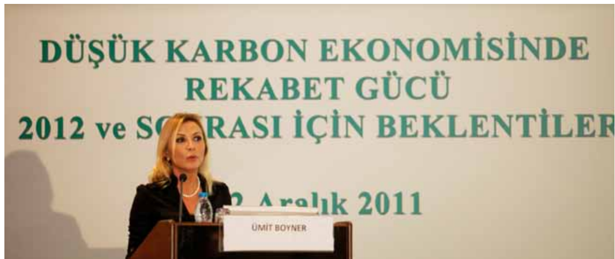
TÜSİAD Yönetim Kurulu Başkanı Ümit Boyner, UBCCE ve TÜSİAD işbirliğiyle düzenlenen "Düşük Karbon Ekonomisinde Rekabet Gücü: 2012 ve Sonrası İçin Beklentiler Konferansı", 22 Aralık 2011.

Birliğin her sene farklı bir ülkede düzenlediği UBCCE İş Forumu da söz konusu proje dahilinde Batum, Gürcistan'da gerçekleştirilmiştir (30 Haziran-2 Temmuz 2011) . Gürcistan Yatırım Ajansı ve TÜRKONFED'in de desteklediği forum, bölge ülkelerinden ve özellikle de Gürcü işadamlarından yoğun ilgi görmüştür.