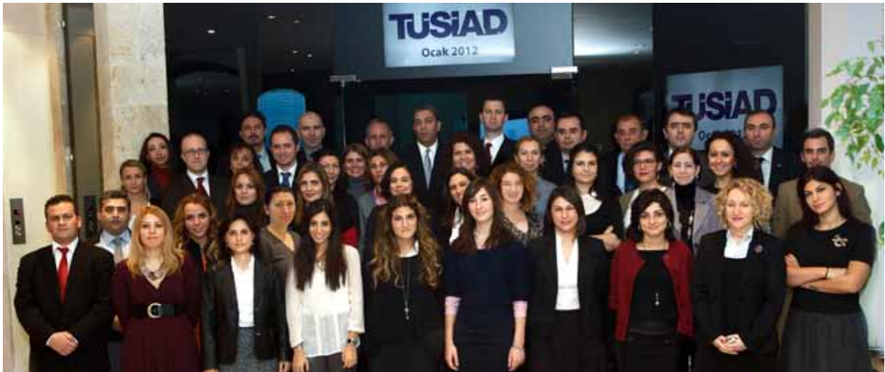
TÜSİAD Genel Sekreterliği kadrosu