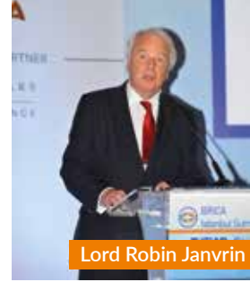
Lord Robin Janvrin

Kuşak ve Yol Girişimi, kadim İpek Yolu'nun tekrar canlanması olarak nitelendirilmektedir. Bununla birlikte insanlık kadim İpek Yolu'ndan günümüze kadar uzunca bir mesafe kat etmiştir. Gittikçe küçülen dünyada insanlar birbirleriyle daha rahat iletişim kurabilmektedir. İletişim kolaylığı ticaretin hızlanmasına, talebin artması ve çeşitlenmesine, talebi karşılayan arzın üretim yeteneklerinin hayal gücünün sınırlarını zorlamasına yol açmaktadır. Zirvenin "Kuşak ve Yol Girişimi Perspektifinden Bölgeler / Kıtalar" panelinde Avrupa, Asya, Kafkasya, Orta Doğu, Afrika, Latin Amerika'daki iş ve yatırım ortamı, doğrudan yabancı yatırıma global bakış, Kuşak ve Yol Girişimi ışığında büyük yatırımcı ülkelerin bakış açıları masaya yatırılmıştır.