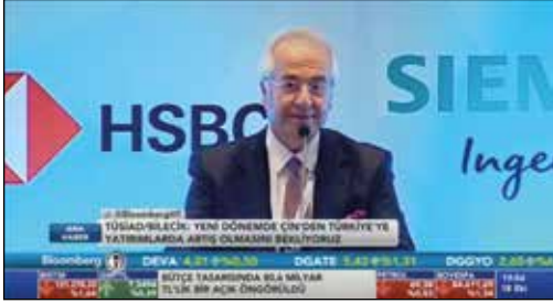
Bloomberg HT / Ana Haber Bülteni