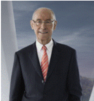
Edzard Reuter, Daimler-Benz AG Eski Yönetim Kurulu Başkanı

Türkiye’de 60’lı yılların başından itibaren süregelen gelişmeleri gözlemlediğimizde, eşi benzeri bulunmayan bir başarı öyküsünden bahsedebiliriz. Türkiye'nin güvenilir bir siyasi ortak olarak her geçen gün gelişmesi, reform sürecini başarılı şekilde uygulaması ve Avrupa'nın ekonomik istikrarına sağladığı katkılar büyük önem taşımaktadır. Birlikte birçok başarı elde ettik. Bu başarıların devam etmesinin gerektiğine inanmaktayım. Gelecekte de hem ekonomik, hem siyasi alanda yeni başarıların altına beraber imza atabiliriz.