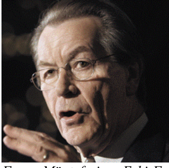
Franz Müntefering, Eski Federal Almanya Cumhuriyeti Çalışma ve Sosyal İşler Eski Bakanı ve Başbakan Yardımcısı