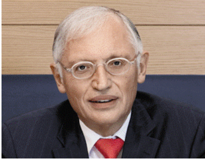
Günter Verheugen, Avrupa Komisyonu Başkan Yardımcısı ve İşletmeler ve Endüstriden Sorumlu Komiser

Bu sürece katılanların iyi niyetli çabaları gerekmektedir. Alınacak sonuçlar buna doğrudur.