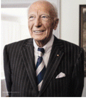
Walter Scheel, Federal Almanya Cumhuriyeti Eski Cumhurbaşkanı